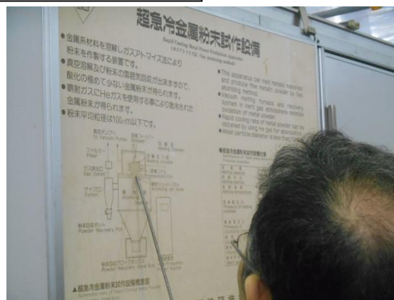
③工場見学の説明(一例)