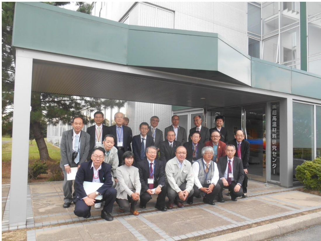
①超高温材料研究センター 玄関での記念撮影